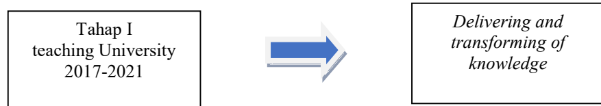
Gambar 2. Alur pelaksanaan melestone tahap I RIP Akper Pemkab Ngawi